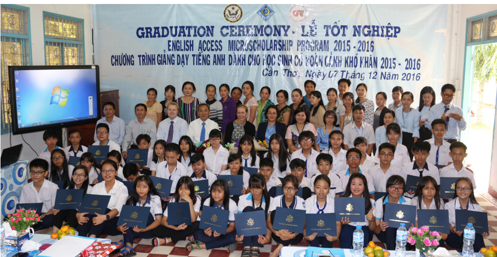
Ảnh lưu niệm tại lễ tốt nghiệp chương trình Access.