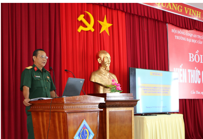
Thượng tá, TS. Trần Huỳnh Hoàng Vũ, Chính ủy Trường Quân sự thành phố Cần Thơ mở đầu lớp học với chuyên đề "Đường lối, quan điểm của Đảng cộng sản, chính sách, Pháp luật của Nhà nước Việt Nam về quốc phòng, an ninh".

Trong thời gian 04 ngày, các học viên được truyền đạt các nội dung cơ bản như: Chiến tranh nhân dân Việt Nam bảo vệ tổ quốc xã hội chủ nghĩa; phòng, chống chiến lược “diễn biến hòa bình”, bạo loạn, lật đổ của các thế lực thù địch đối với cách mạng Việt Nam; một số vấn đề kết hợp phát triển kinh tế-xã hội gắn với tăng cường củng cố quốc phòng-an ninh; quản lý, bảo vệ chủ quyền biển, đảo và biên giới quốc gia Việt Nam trong thời kỳ mới; xây dựng, hoạt động của lực lượng tự vệ, dự bị động viên cơ quan đáp ứng yêu cầu nhiệm vụ trong tình hình mới và một số vấn đề cơ bản bảo đảm an ninh chính trị, tư tưởng, văn hóa, kinh tế, xã hội trong tình hình mới.