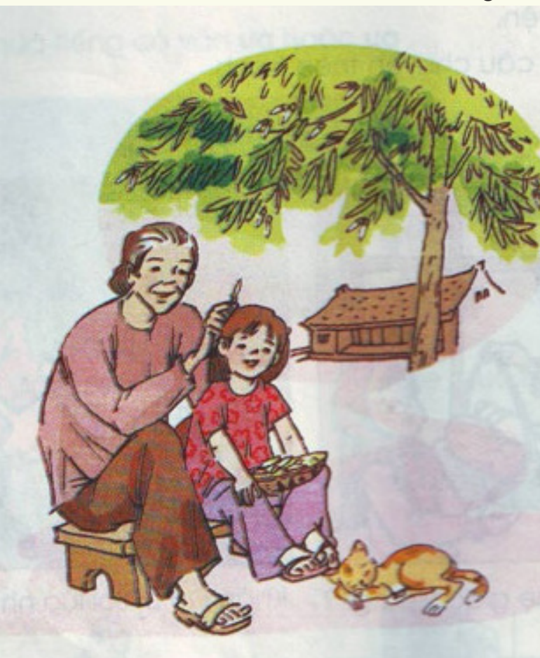
Ảnh minh họa.

Thời gian thấm thoát trôi qua và tôi đã trở thành một cô sinh viên năm ba đại học. Dù rằng việc học rất căng thẳng, công việc làm thêm cũng khá bận bịu nhưng tôi vẫn đều đặn gọi điện về nhà hỏi thăm ngoại và ba mẹ. Vì tôi biết, tôi còn có ngoại để yêu thương thì đó đã là điều tuyệt vời nhất rồi. Ngoài kia còn có biết bao người bất hạnh đã không còn ngoại, ba mẹ bên cạnh. Vì thế, chúng ta phải biết trân trọng những gì mình đang có, sống thật tốt và ý nghĩa với những người xung quanh; quan tâm, yêu thương ông bà, cha mẹ của mình nhiều hơn và đừng ngại thể hiện yêu thương với người mà mình yêu quý.