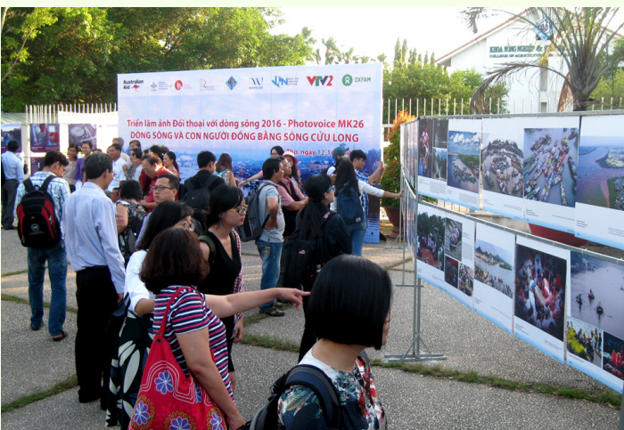
Toàn cảnh khu Triển lãm ảnh.

Ngày 12/11/2016, tại Khoa Nông nghiệp và Sinh học Ứng dụng-Trường Đại học Cần Thơ, Mạng lưới Sông ngòi Việt Nam (VRN) cùng Trung tâm Bảo tồn và Phát triển tài nguyên Nước (WARECOD) và Viện Nghiên cứu Biến đổi Khí hậu đã phối hợp tổ chức chuỗi sự kiện “Dòng sông và Con người Đồng bằng sông Cửu Long 2016”. Đây là hoạt động nằm trong khuôn khổ “Chuỗi sự kiện hội thảo thường niên của Mạng lưới sông ngòi Việt Nam 2016” từ 12/11 đến 14/11/2016 tại Thành phố Cần Thơ.