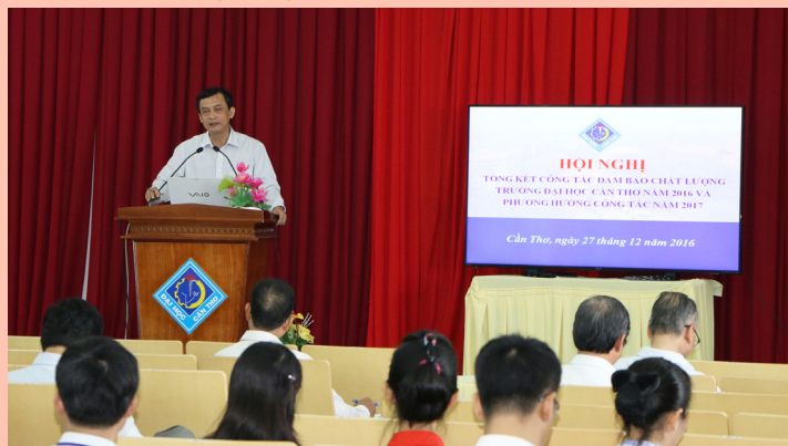
Hội nghị Tổng kết Công tác ĐBCL Trường ĐHCT năm 2016.

Trong thời gian tới, một số hoạt động cụ thể được xúc tiến như: thực hiện kiểm định Trường theo bộ tiêu chuẩn mới của Bộ Giáo dục và Đào tạo; kiểm định chất lượng CTĐT chuẩn bị cho việc đánh giá ngoài đối với các CTĐT chất