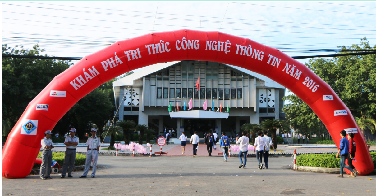
Lễ Khai mạc Tuần lễ Khám phá tri thức CNTT năm 2016 diễn ra tại Hội trường Lớn.