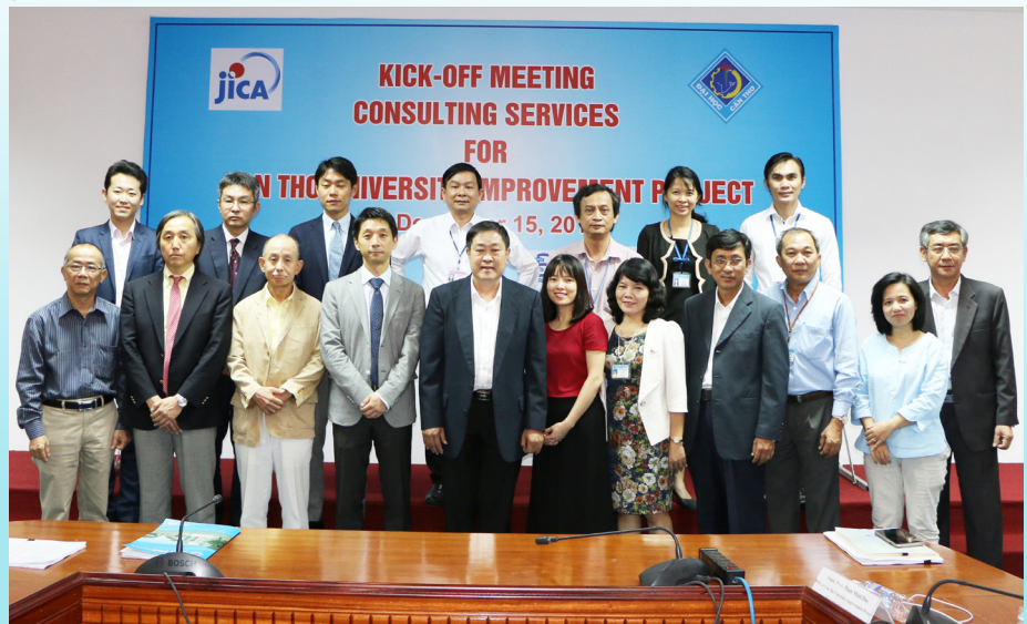
Ảnh lưu niệm.