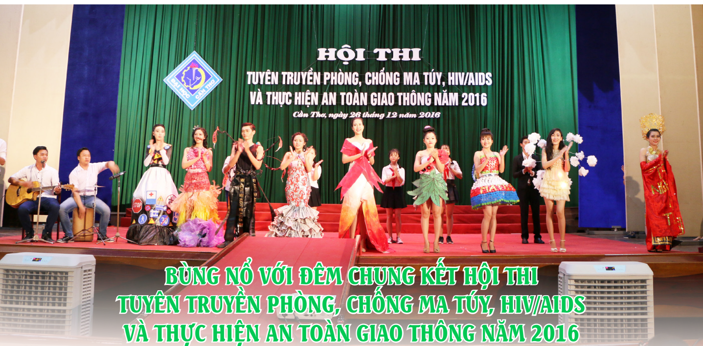
Trung tâm Thông tin và Quản trị mạng

N hằm nâng cao nhận thức trong cán bộ, học sinh, sinh viên về hiểm họa của ma túy, đại dịch HIV/AIDS; nâng cao tầm quan trọng của công cuộc phòng, chống ma túy, HIV/AIDS đối với sự phát triển kinh tế, văn hóa, xã hội của đất nước; tuyên truyền, giáo dục ý thức chấp hành các quy định của pháp luật về