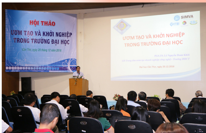
Hội thảo Ơm tạo và Khởi nghiệp trong trường đại học diễn ra tại Hội trường Trung tâm Học liệu, Trường ĐHCT ngày 20/12/2016.

Trong đó, Trung tâm ươm tạo doanh nghiệp công nghệ Trường ĐHCT được thành lập từ năm 2014, hiện nay, Trung tâm là đầu mối tích hợp nguồn lực từ các khoa, viện, trung tâm nghiên cứu ứng dụng để hiện thực hóa những ý tưởng sáng tạo, khởi nghiệp, cạnh tranh toàn cầu; cung cấp các dịch vụ tư vấn về đổi mới khoa học công nghệ và quản trị doanh nghiệp; triển khai dự án SIMVA (Trung tâm Ơm tạo doanh nghiệp quy mô vừa và nhỏ Mekong-Việt Nam-Đông Nam Á); liên kết với các dự án quốc tế về phát triển doanh nghiệp khoa học công nghệ đổi mới sáng tạo như: IPP (Chương trình Đối tác đổi mới sáng tạo Việt Nam-Phần Lan), FIRST (Dự án đẩy mạnh đổi mới sáng tạo thông qua nghiên cứu, khoa học và công nghệ), VIIP (Dự án Đổi mới sáng tạo hướng tới người thu nhập thấp), BIPP (Dự án Hỗ trợ xây dựng chính sách đổi mới và phát triển các cơ sở ươm tạo doanh nghiệp).