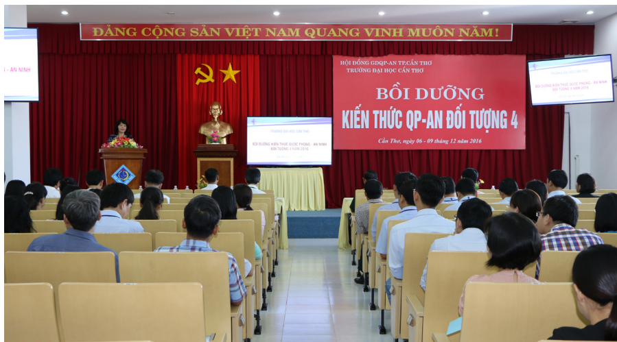
Lễ Khai giảng khóa học bồi dưỡng kiến thức Quốc phòng - An ninh đối tượng 4 năm 2016.

Theo đó, khóa học diễn ra trong thời gian 04 ngày, từ ngày 06-09/12/2016 với sự tham gia của 200 học viên là viên chức