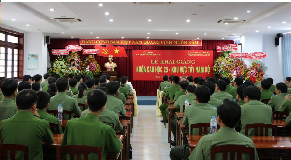
Toàn cảnh Lễ Khai giảng khóa cao học 25 - khu vực Tây Nam Bộ.

Ngày 09/12/2016, Học viện An ninh Nhân dân (ANND) phối hợp cùng Trường Đại học Cần Thơ (ĐHCT) long trọng tổ chức Lễ Khai giảng khóa cao học 25-khu vực Tây Nam Bộ, khóa đào tạo trình độ thạc sĩ đầu tiên do Học viện ANND và Trường ĐHTC liên kết đào tạo cho công an các tỉnh khu vực Tây Nam Bộ.