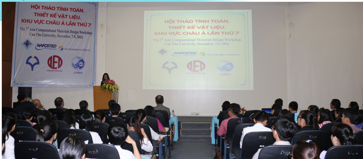
Toàn cảnh Hội thảo Tính toán thiết kế vật liệu khu vực châu Á lần thứ 7 tại Trường ĐHTC.

Ngày 07/12/2016, Trường Đại học Cần Thơ (ĐHCT) phối hợp Quỹ Phát triển Khoa học Công nghệ, Trường ĐH Osaka, Trường ĐH Tokyo, Nhật Bản tổ chức Hội thảo Tính toán thiết kế vật liệu khu vực châu Á lần thứ 7.