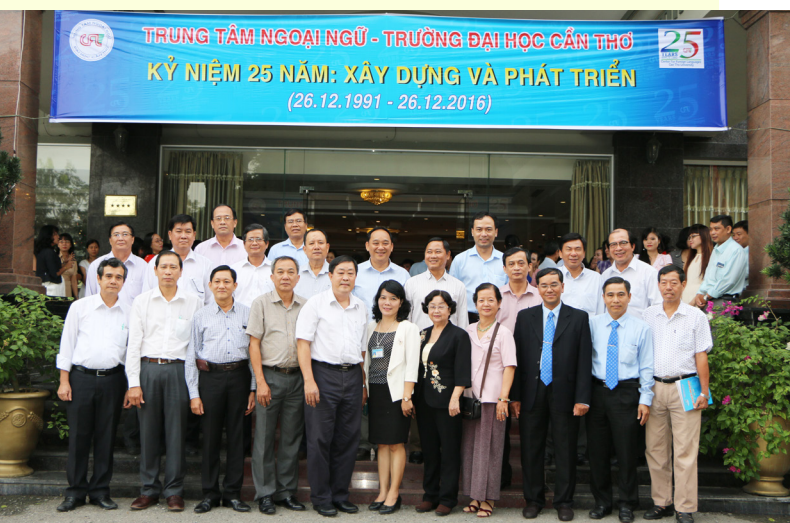
Ảnh lưu niệm.

Là một đơn vị trực thuộc Trường ĐHTC, Trung tâm Ngoại ngữ luôn cố gắng hoàn thành tốt nhiệm vụ của mình. Trong năm học 2015-2016, Trung tâm được công nhận là Tập thể Lao động xuất sắc và được trao tặng Cờ thi đua của Bộ Giáo dục và Đào tạo. Đó là minh chứng cho sự lớn mạnh và những đóng góp tích cực của Trung tâm trong sự phát triển chung của Nhà trường.