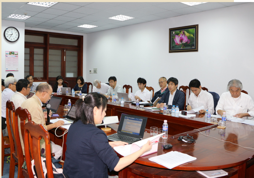
Buổi làm việc với đoàn giáo sư Nhật Bản về lĩnh vực môi trường.

Trong lĩnh vực nông nghiệp, đoàn Giáo sư gồm 04 thành viên từ Trường Đại học Hokkaido và Trường Đại học Kyushu phối hợp Khoa Nông nghiệp và Sinh học Ứng dụng, Trường ĐHTC tổ chức các buổi tập huấn về di truyền cây lúa nhằm cung cấp thông tin và đóng góp các ý tưởng cho 16 chương trình nghiên cứu thuộc lĩnh vực này trong Dự án Nâng cấp Trường ĐHTC, đồng thời, các Giáo sư đã gặp gỡ và trao