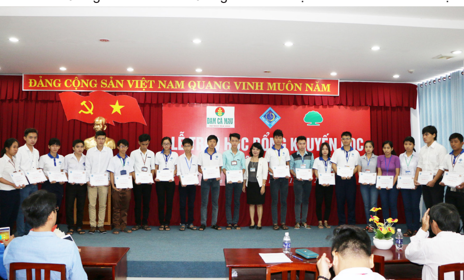
Trao học bổng khuyến học của Trường ĐHCT cho 70 sinh viên.

Tại buổi lễ trao học bổng năm nay, có tổng số 124 sinh viên được nhận học bổng trong đó, 70 em nhận học bổng khuyến học của Trường ĐHCT với mỗi suất trị giá 3.000.000 đồng; 50 em nhận học bổng “Đạm Cà Mau - Hạt ngọc mùa vàng” với mỗi suất trị giá 7.000.000 đồng và 04 em nhận học bổng của Công ty Cathay Life với mỗi suất học bổng trị giá 16.000.000 đồng.