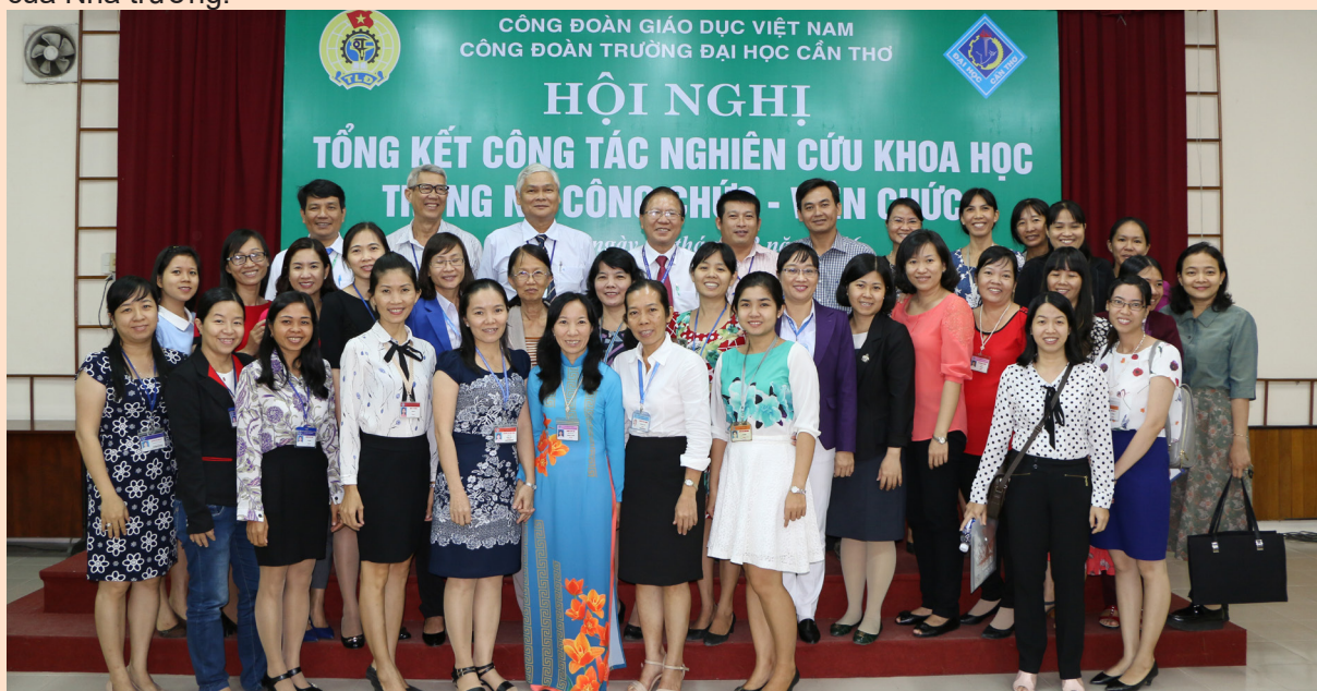
Đại biểu chụp ảnh lưu niệm.

Tại Hội nghị, các đại biểu đã nghe báo cáo tổng kết công tác NCKH trong nữ CC-VC, thực trạng NCKH, những khó khăn trong thực hiện hoạt động nghiên cứu, từ đó, thảo luận, chia sẻ những kinh nghiệm và những định hướng trong công tác NCKH của nữ CC-VC Trường ĐHCT trong thời gian tới.