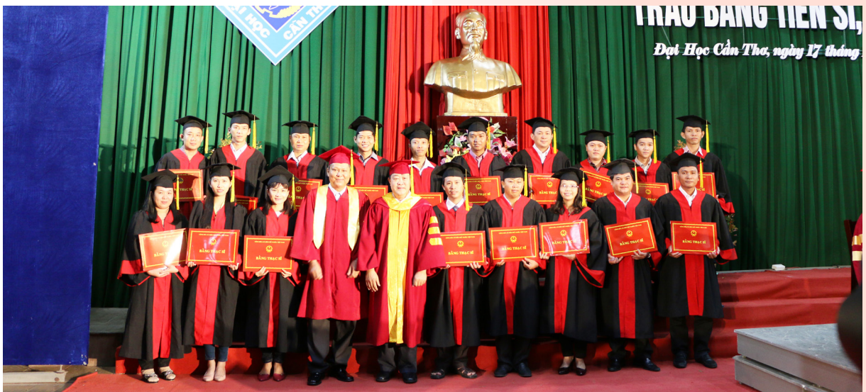
Chụp ảnh lưu niệm cùng các tân thạc sĩ.

nay khoảng 3.800 thạc sĩ và tiến sĩ (400 nghiên cứu sinh và 3.400 học viên cao học). Tại buổi lễ, có tất cả 09 nghiên cứu sinh được trao bằng tiến sĩ và 560 học viên cao học được trao bằng thạc sĩ. Như vậy, tính đến thời điểm hiện tại số lượng nghiên cứu sinh và học viên cao học của Trường đã tốt nghiệp là 83 tiến sĩ và 8.448 thạc sĩ. Hy vọng rằng đây sẽ là lực lượng nòng cốt, tiên phong trong sự nghiệp phát triển kinh tế-xã hội vùng Đồng bằng sông Cửu Long, đóng góp vào sự phát triển chung của đất nước.